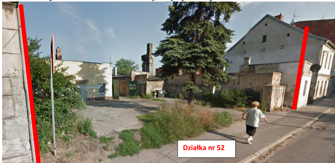
Fotografia nr 1

Działka nr 52 jest nie zabudowana od strony ulicy Rycerskiej.