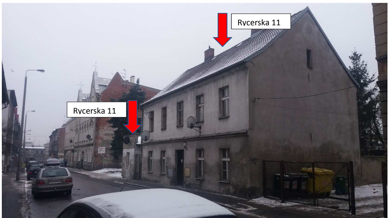
Fotografia nr 3