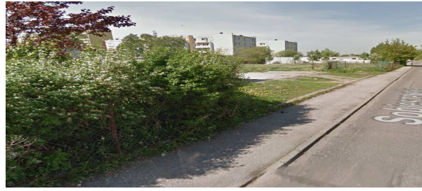
Widok od ul. Sobiszewskiej.

Chodnik przynależny do nieruchomości niezabudowanej.