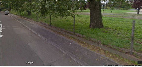
Widok od ul. Swarzewskiej.